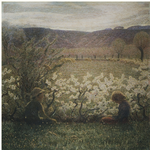
Giuseppe Pellizza da Volpedo, Prato fiorito , 1900-1903 Galleria Nazionale d'Arte Moderna e Contemporanea